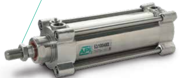
Cilindri AMX ISO 15552 - Alesaggi da 32 a 200 mm Cylinders ISO 15552 AMX - Bores from 32 to 200 mm

Certified company UNI EN ISO 9001 : 2008. A.P.I. is a Trade mark registered or used by A.P.I. S.r.l.